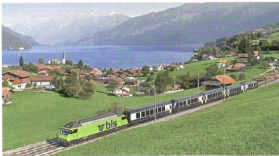
Golden Pass Express am Thunersee

09:45 Einführungsreferat: Ueli Stückelberger, Direktor VÖV: Fahrplan der Zukunft: Taktfahrplan+ = Ergänzung des Taktfahrplans durch flexible auf den Freizeitverkehr zugeschnittene Angebote