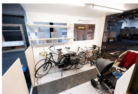
Versuchslabor Multifunktionsabteil (SOB)