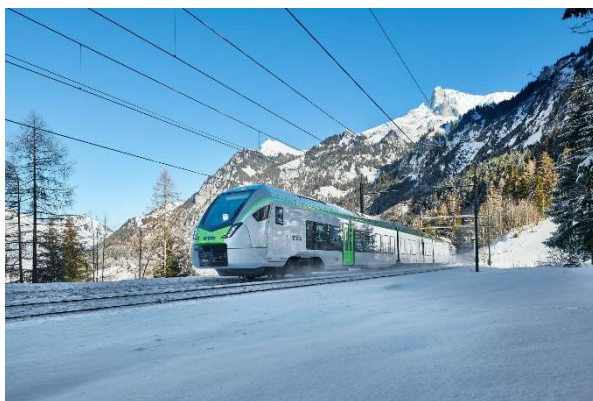
Mika Schneezug der BLS am Lötschberg