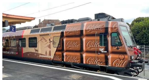
Chocolat Express Cailleur TPF (Westiform)