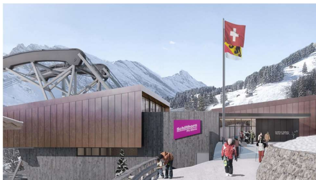
Schilthornbahn 20XX mit Transportbehälter